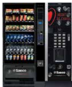
Artico L + Atlante Evo 500