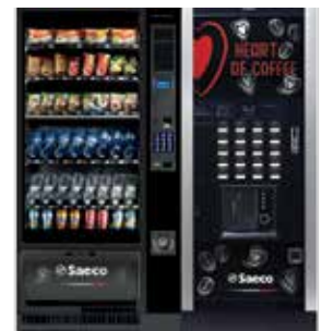
Artico L + Atlante Evo 700