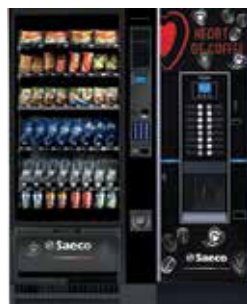
Artico L + Cristalino Evo 600